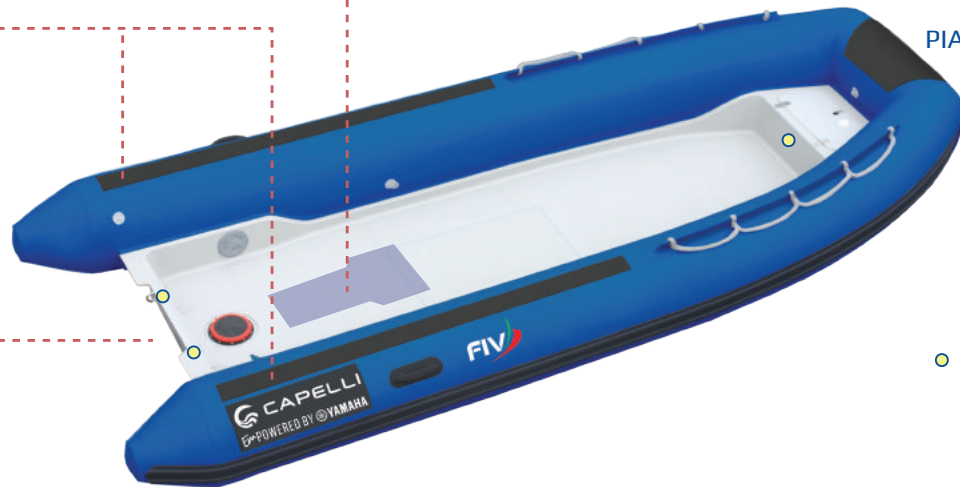
PIATTINA RIGATA PRUA