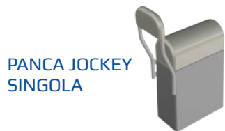
PANCA JOCKEY SINGOLA