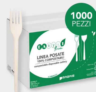
GREEN FORCHETTA COMPACT cod. PRO39751 - M0002406