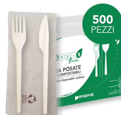
GREEN BIS CON TOVAGLIOLO RICICLATO cod. PRO39749 - M0002404

Il CPLA deriva dalla cristallizzazione del PLA, la quale ne aumenta notevolmente la resistenza al calore al punto di poter sopportare temperature fino a 85° senza deformazione o scioglimento.