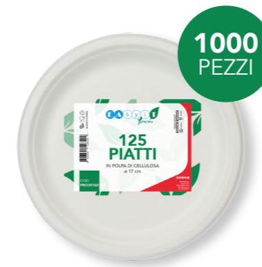
GREEN PIATTO PIANO Ø 17 cm cod. PRO39760 - M0021288

La polpa di cellulosa, essendo un materiale completamente naturale di origine vegetale e privo di componenti chimici, secondo la norma europea EN13432 è biodegradabile e compostabile.