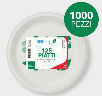
GREEN PIATTO PIANO Ø 22 cm cod. PRO39761 - M0021289