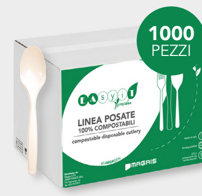
GREEN CUCCHIAINO COMPACT cod. PRO39754 - M0002409