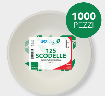
GREEN SCODELLE 400 ML cod. PRO39763 - M0021293