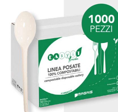
GREEN CUCCHIAIO COMPACT cod. PRO39753 - M0002408