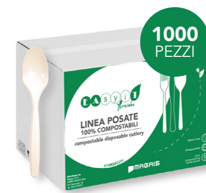
GREEN CUCCHIAINO IMBUSTATO SINGOLO cod. PRO39755 - M0002410