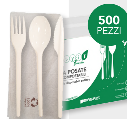
GREEN TRIS CON TOVAGLIOLO RICICLATO cod. PRO39750 - M0002405