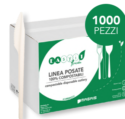
GREEN COLTELLO COMPACT cod. PRO39752 - M0002407