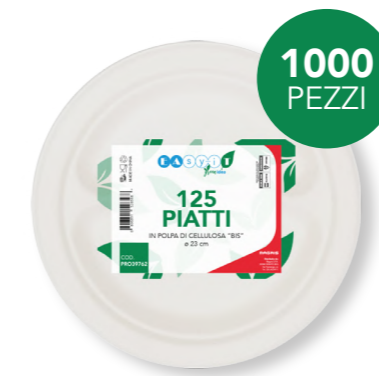
GREEN PIATTO BISCOMPARTO Ø 23 cm cod. PRO39762 - M0021290